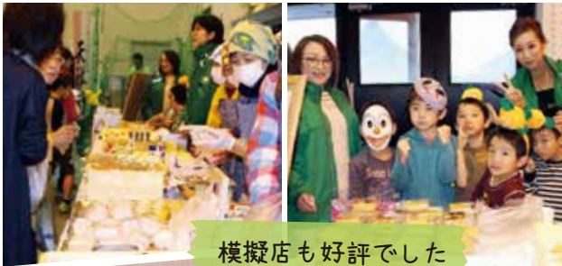
模擬店も好評でした