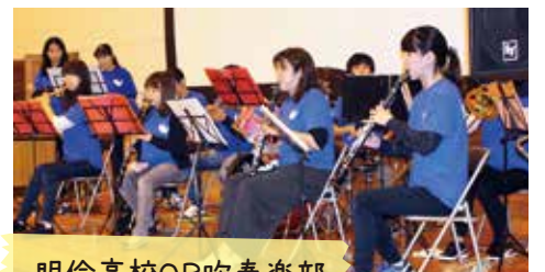
明倫高校OB吹奏楽部

10月27日、「JA白山 農業まつり」を開催しました。 あいにくの雨模様でしたが、開場時間になると多くのお客様にご来場いただきました。 本年は特別企画としてJA自己改革をアピールするため、会場正面のスクリーンに「白山農業と自己改革」と題しプロジェクトを投影、JAの置かれている状況やJA白山の取り組みを紹介しました。 旬の農産物の即売ではブロッコリーや白山ねぎなど新鮮な地元産直野菜が並んだ販売ブースが賑わい、みかんの詰め放題は親子連れに大人気でした。地産地消フードコートでは、