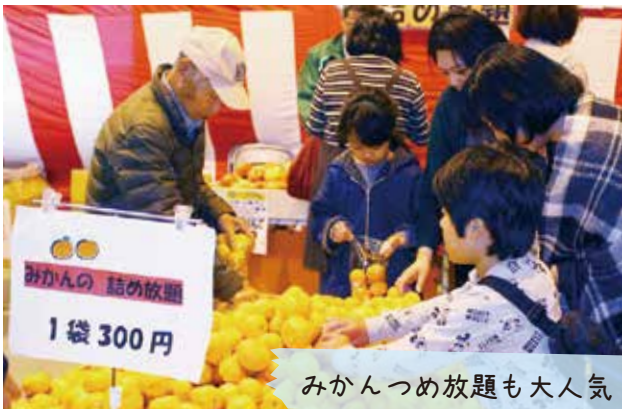
みかん詰め放題も大人気