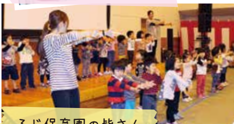
ふじ保育園の皆さん