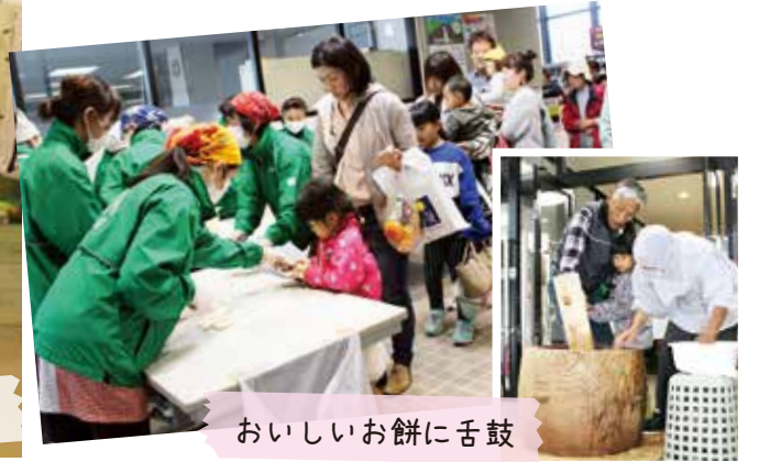
おいしいお餅に舌鼓