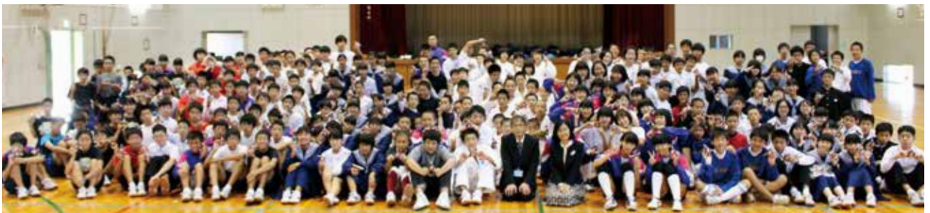
全員揃って記念写真撮影（北辰中学校のみなさん）