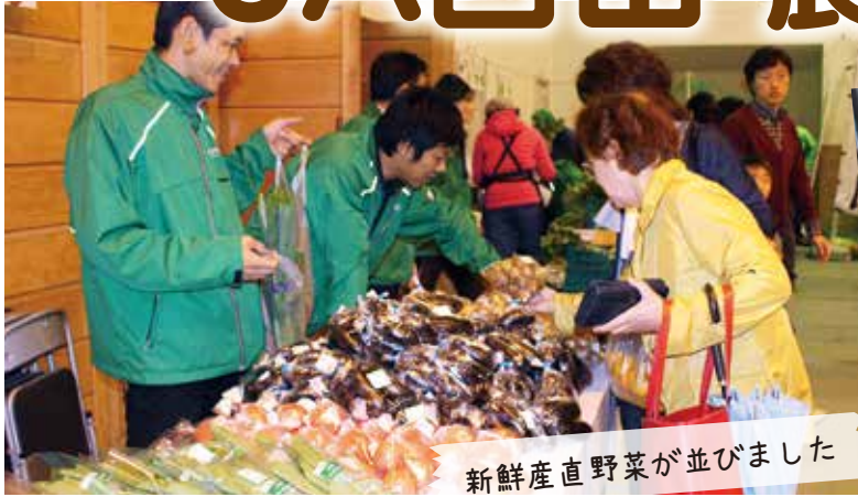
新鮮産直野菜が並びました