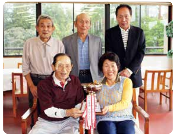
団体の部優勝 手取Bチームのみなさん