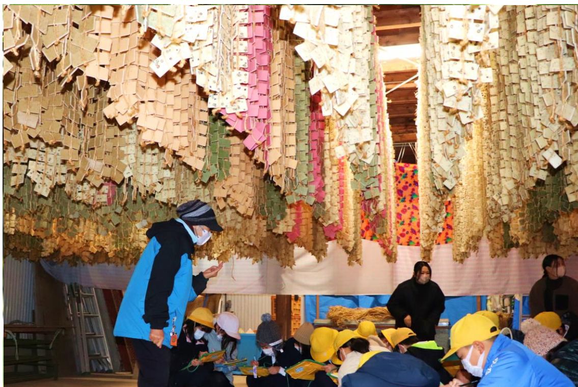
食農教育活動：かきもち自然乾燥見学