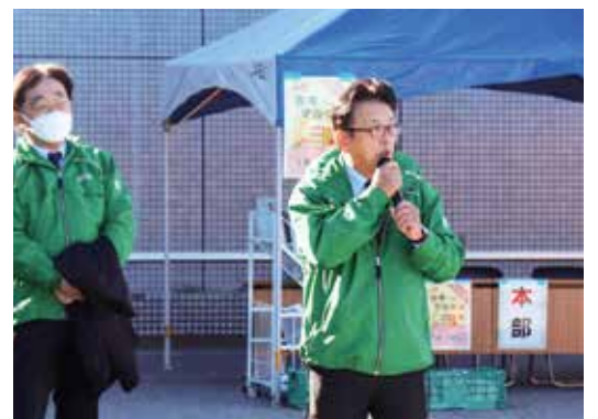
挨拶する柄田組合長