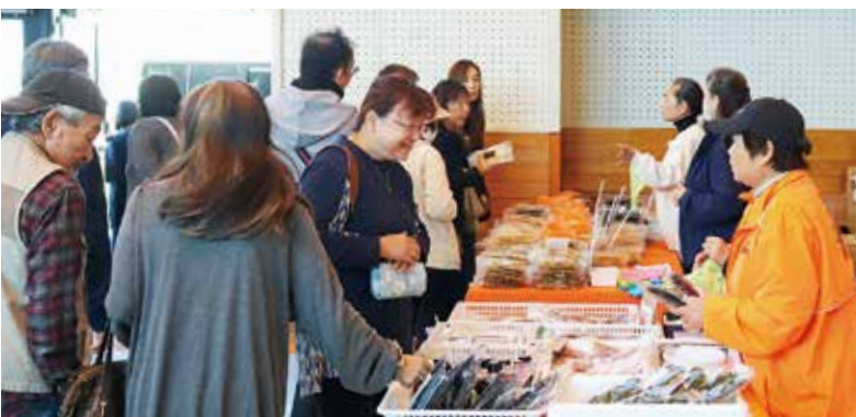
輪島朝市のみなさん

農業まつりの開催にご協力頂いた学生の皆さま、関係業者の皆さま、青壮年部・女性部の皆さま、そしてご参加頂いた組合員の皆さまに改めて感謝申し上げます。JA白山では今後も地元に着目した活動を通じて地域の活性化に努めて参ります。