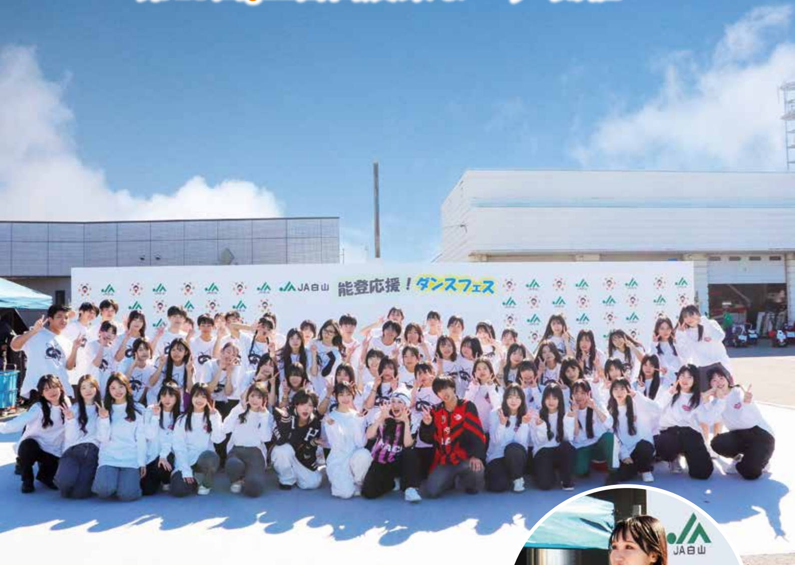
表紙の写真 JA白山農業まつりストリートダンスフェス (遊学館・小松市立・金沢二水高校の皆さん)